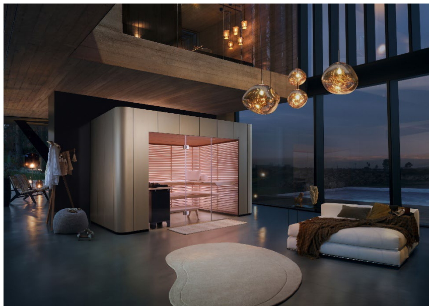
Die Sauna als Designobjekt: die Sauna S11. Design by Studio F. A. Porsche.

Individueller, multisensorischer, smarter und noch nachhaltiger: Die Wellnessrends 2025 prägen nicht nur die Zukunft der Sauna- und Spabranche, sondern verbessern auch das allgemeine Wohlbefinden im Alltag zunehmend – mit exklusiven, hochwirksamen Wellnesslösungen, die Körper und Geist durch ganzheitliche Erlebnisse stärken.